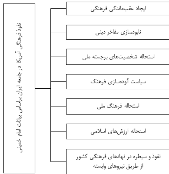
شکل شماره ۳. شیوه و راهبردهای نفوذ فرهنگی در جامعه ایرانی براساس بیانات امام خمینی

در راستای همین سیاست بوده که علاوه بر اقتصاد، سیاست و امور نظامی، آمریکا در امور فرهنگی ایران نیز مداخله و نفوذ داشته است (صحیفه امام، ج ۴: ۴۶۵). برخی از گزاره‌های استخراج‌شده از بیانات امام خمینی در زمینه نفوذ فرهنگی آمریکا به شرح زیر است: آمریکا بر نهادهای فرهنگی ایران سیطره داشته است؛ آمریکا در صدد نابودی مفاخر اسلامی و ملی ایرانیان است؛ و آمریکا عامل استحاله فرهنگ دینی و ملی ایران بوده است.