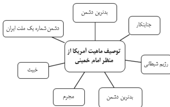
شکل شماره ۲. توصیف ماهیت آمریکا در گفتار و اندیشه امام خمینی (یافته‌های پژوهش)

کدهای استخراج‌شده از صحیفه امام پیرامون ماهیت آمریکا نشان می‌دهند ذات استثماری و جوهره استعماری آمریکا در گفتار امام خمینی با واژگانی همچون «وحشی»، «شیطانی»، «خبیث»، «منفورترین کشور»، «جنایتکار»، «بدترین دشمن»، «دشمن شماره یک ملت ایران»، «مجرم» و غیره توصیف شده است.