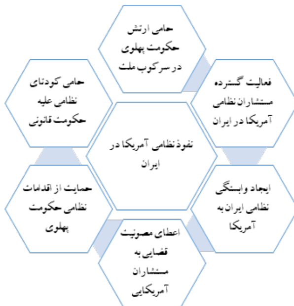
شکل شماره ۴. راهبردهای نفوذ نظامی آمریکا در ایران براساس گفتارهای امام خمینی (یافته‌های پژوهش)

به قرار زیر است: آمریکا در ارتش ایران نفوذ داشته است؛ آمریکا حامی ارتش پهلوی در سرکوب ملت ایران بود؛ آمریکا حامی کودتای نظامی علیه ملت ایران بوده است؛ حمایت نظامی آمریکا از حکومت پهلوی عامل ماندگاری استبداد در ایران شد؛ مستشاران آمریکایی در حمایت از حکومت پهلوی فعالیت داشتند؛ و آمریکا عامل وابستگی نظامی ارتش ایران بوده است.