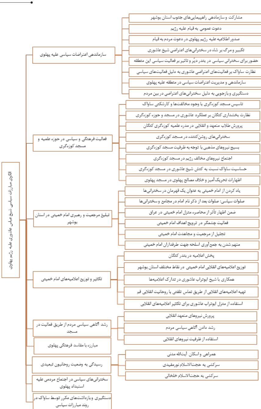
شکل شماره ۳. الگوی کنشگری سیاسی شیخ عباس عاشوری علیه رژیم پهلوی